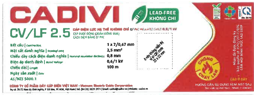
Mặt trước thiết kế nhãn hiện hành