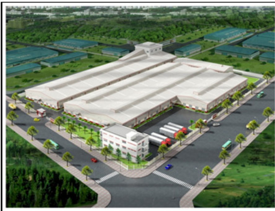
Phối cảnh Nhà máy sản xuất dây cáp điện tại KCN Tân Phú Trung Giai đoạn 1 của dự án: “Nhà máy sản xuất cáp ngầm trung thế và hạ thế” sẽ hoàn thành trong năm 2012