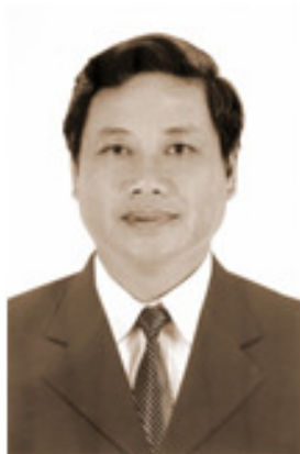
Sinh năm 1960 Thạc sĩ QTKD Kỹ sư Hóa Cử nhân tiếng Anh