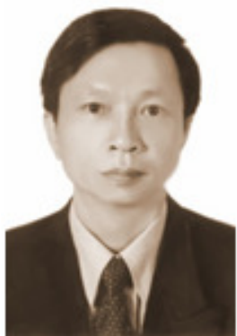
Sinh năm 1956 Cử nhân Kinh tế