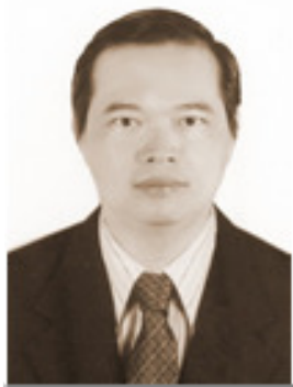
Sinh năm 1964 Kỹ sư Cơ khí