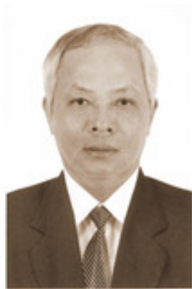
Sinh năm 1952 Cử nhân Vật lý