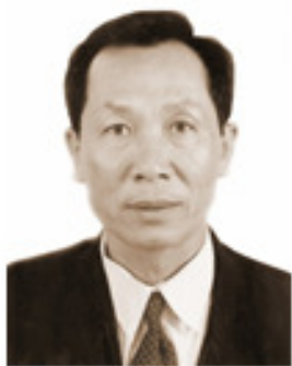
Sinh năm 1954 Kỹ sư Hóa