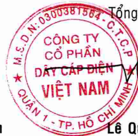
Lê Quang Định