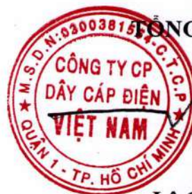
Lê Quang Định